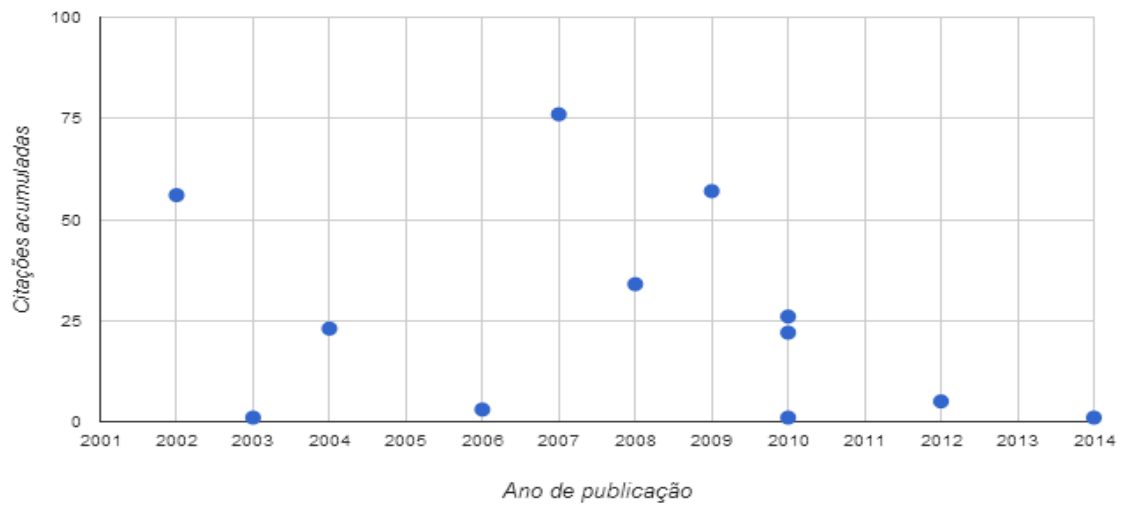
Figura 3. Citações acumuladas por artigo.